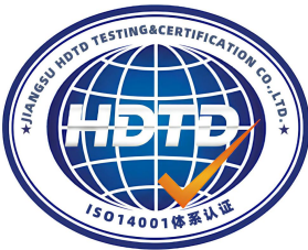
HDTD 机构 14001 标徽